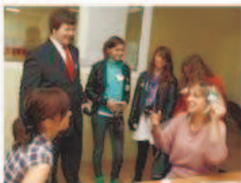
Gimnazjaliści przepytawali dziennikarzy "Głosu" ze znajomości tabliczki mnożenia.

Uczniowie ze słupskiego Gimnazjum nr 3 odpytywali w piątek mieszkańców ze znajomości tabliczki mnożenia. Kto się pomylił, dostawał mandat.